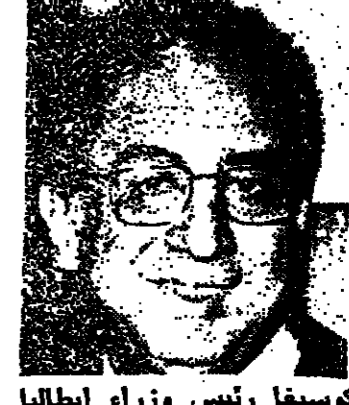
كوسيفا رئيس وزراء ايطاليا